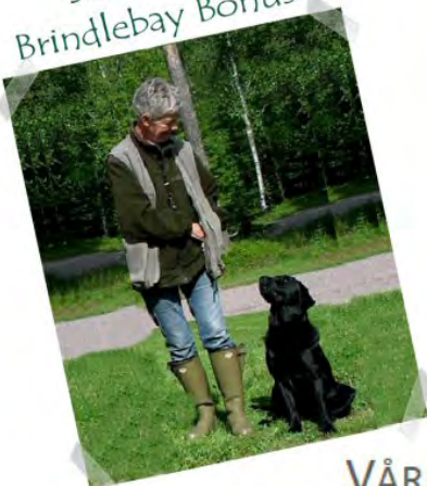
SE J(J)CH Brindlebay Bonus