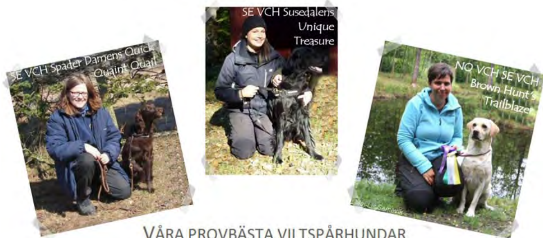
VÅRA PROVBÄSTA VILTSPÅRHUNDAR